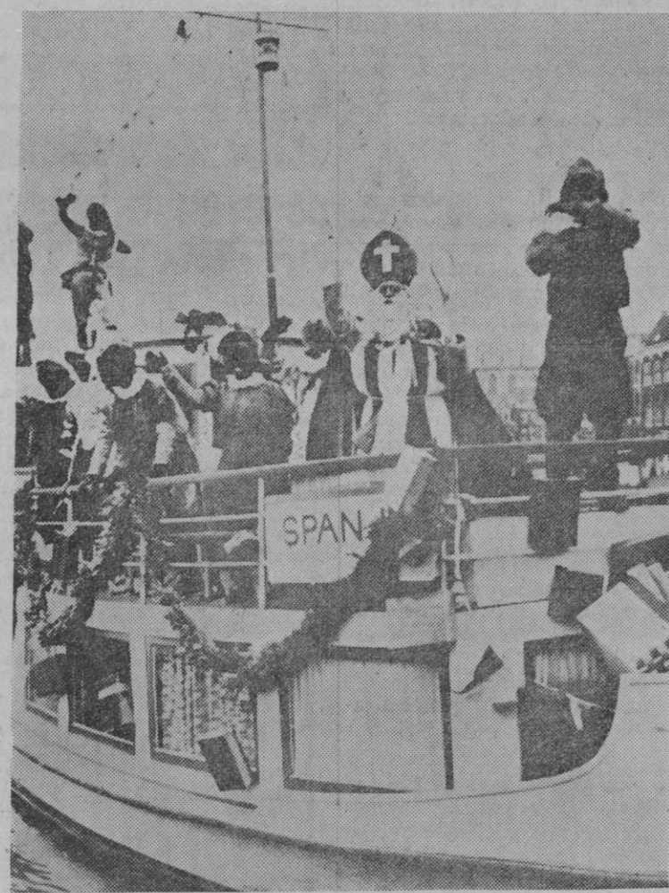
Es ya conocida la tradición holandesa de que la Santa Claus navegando llega todos los años procedente de España con regalos para los pequeños. El de este año ya ha llegado, y en la foto le vemos cuando intenta atracar con su barco en el puerto de Haarlem (Holanda). Llega rodeado por sus paques de color, cargado de paquetes y con el nombre de España en la embarcación.

público la «Expotur». Durante el período de apertura se celebrarán recitales de danzas y cante por grupos folklóricos españoles e intervendrán, entre otros, los Coros y Danzas de la Sección Femenina y el ballet de Carmen Rojas. También habrá desfiles de modas y se sorteará, diariamente, entre los visitantes, un viaje a España.