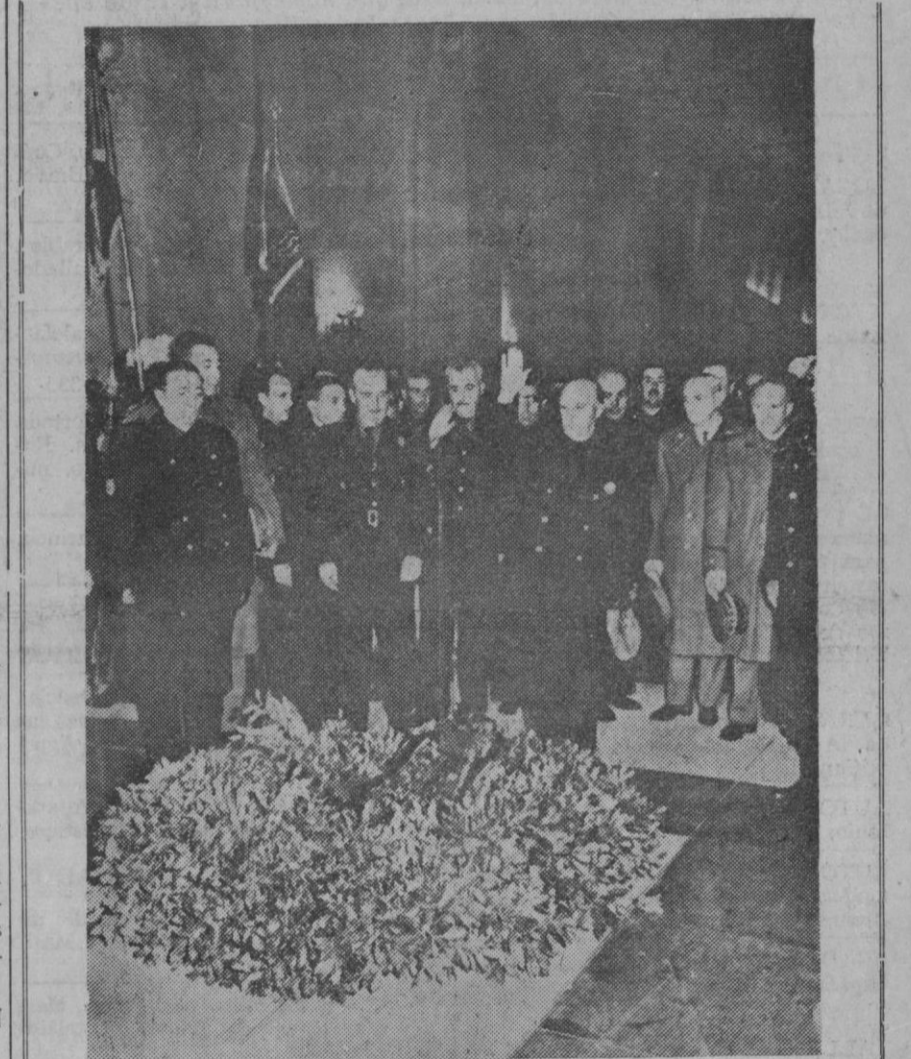
Su Excelencia el Jefe del Estado, en un momento de las solemnes honras fúnebres celebradas en la basílica de la Santa Cruz del Valle de los Caídos, por el alma de José Antonio, en el XXIX aniversario de su muerte, y de todos los caídos por Dios y por España.

El plan francés de colocar un satélite de 83.7 libras en órbita, mediante el uso del proyectil-cohete francés «Diamante», fue predicho, en principio, para el lunes pasado, para que el lanzamiento coincidiese con el setenta y cinco cumpleaños del Presidente. Pero por motivos que aún se mantienen en secreto, el lanzamiento del satélite francés «A-1» desde la base de Hammaguir en el Sahara, no se llevó a cabo. Se señala ahora que el lanzamiento se llevará a cabo entre hoy y mañana.—Efe.