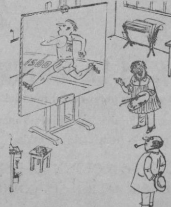
—Este cuadro está pintado en tres minutos, treinta y seis segundos, cuatro décimas