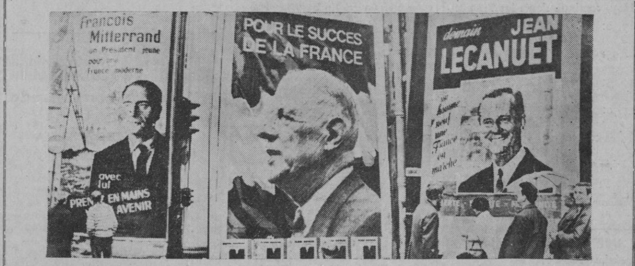
Paris.—Han hecho su aparición en las calles de París los primeros carteles de propaganda de los distintos candidatos para las elecciones presidenciales francesas del día cinco de diciembre próximo. A la izquierda, el cartel de Mitterrand. En el centro, De Gaulle. A la derecha el de Lecanuet

El profesor Middleton figura como delegado del I Congreso Mundial de Desintoxicación de la Atmósfera, que viene celebrándose en la capital argentina. Conjuntamente con Los Angeles—según dijo—, a su juicio, encabeza la lista de ciudades de mayor índice de intoxicación atmosférica en el ambiente, dijo también haber encontrado que Buenos Aires cuenta con una gran contaminación.—Efe.