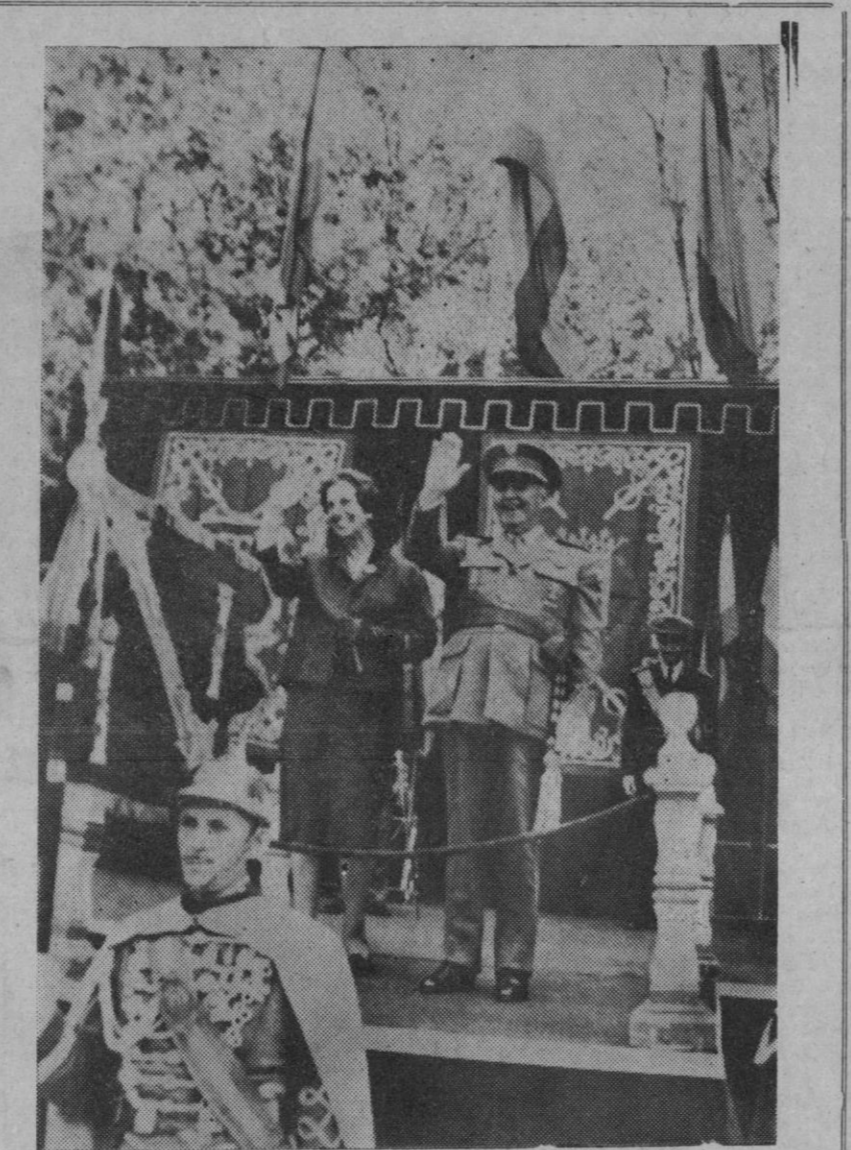
El Caudillo y su esposa, saludando desde la tribuna de honor, durante el desfile celebrado en El Pardo, con ocasión de la onomástica de Su Excelencia el jefe del Estado, el pasado día 4.

Lyon (Francia), 7.—Los vehículos que circulaban por la autopista Lyon-Grenoble formaron una larga cola, mientras una gran tortuga cruzaba sin prisas alguna por medio de la calzada.—Efe.