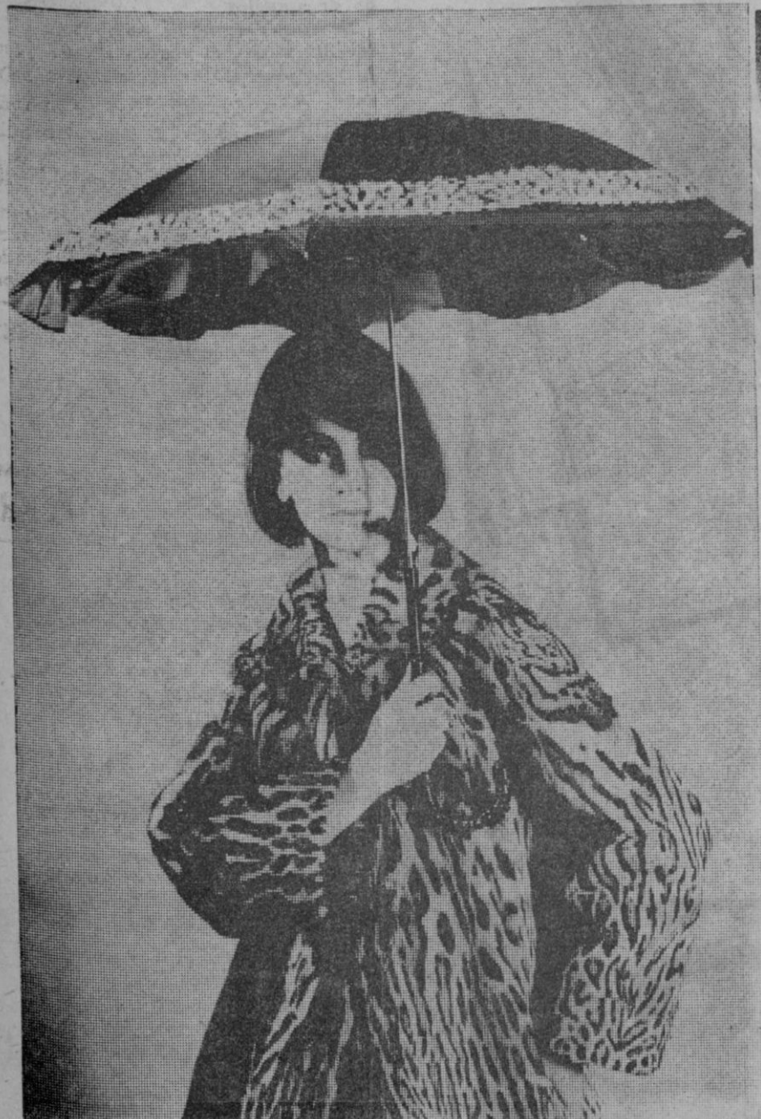
Homburgo.—Modelos llenos de imaginación ha creado la industria alemana de paraguas para la temporada de modas mil novecientos sesenta y cinco-senta y seis. El paraguas con guarnición de pieles (el de la foto), que hace juego con el abrigo de pieles de visón, ocelote, leopardo y de astracán, no es la única novedad atractiva que promete éxito. Despiertan mucho entusiasmo entre la clientela también los modelos de tela ribeteada con brocado o adornada con pinturas hechas a mano

Un armario ropero, grande estaba colocado en la pared opuesta. Era de pino pintado. Tenía en el centro un hueco con luz donde dos mesitas estaban dispuestas para estudiar o leer, con unas baldas donde colocar libros o juguetes pequeños. Dos grandes cajones, al ras del suelo, estaban dispuestos para guardar tesoros. Encima del armario propiamente dicho, pero con la altura necesaria para que pue-