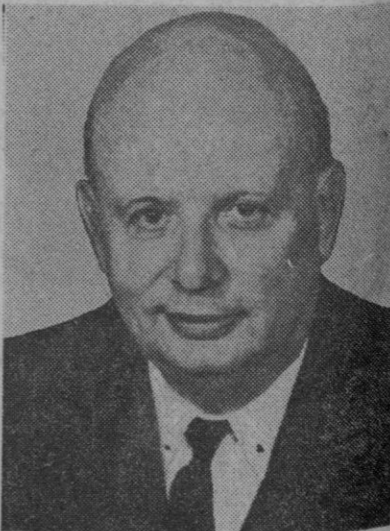
Charles Lucet, diplomático, de cincuenta y cinco años, ha sido nombrado embajador de Francia en Washington, como sucesor de Hervé Alphand

La reforma es de tal modo importante que el elemento vital consiste «no en vencer batallas a corto plazo, sino en establecer bases internacionales fundamentales para un sistema monetario internacional que permita un desarrollo ordenado de las relaciones comerciales y monetarias entre los países en los años venideros».