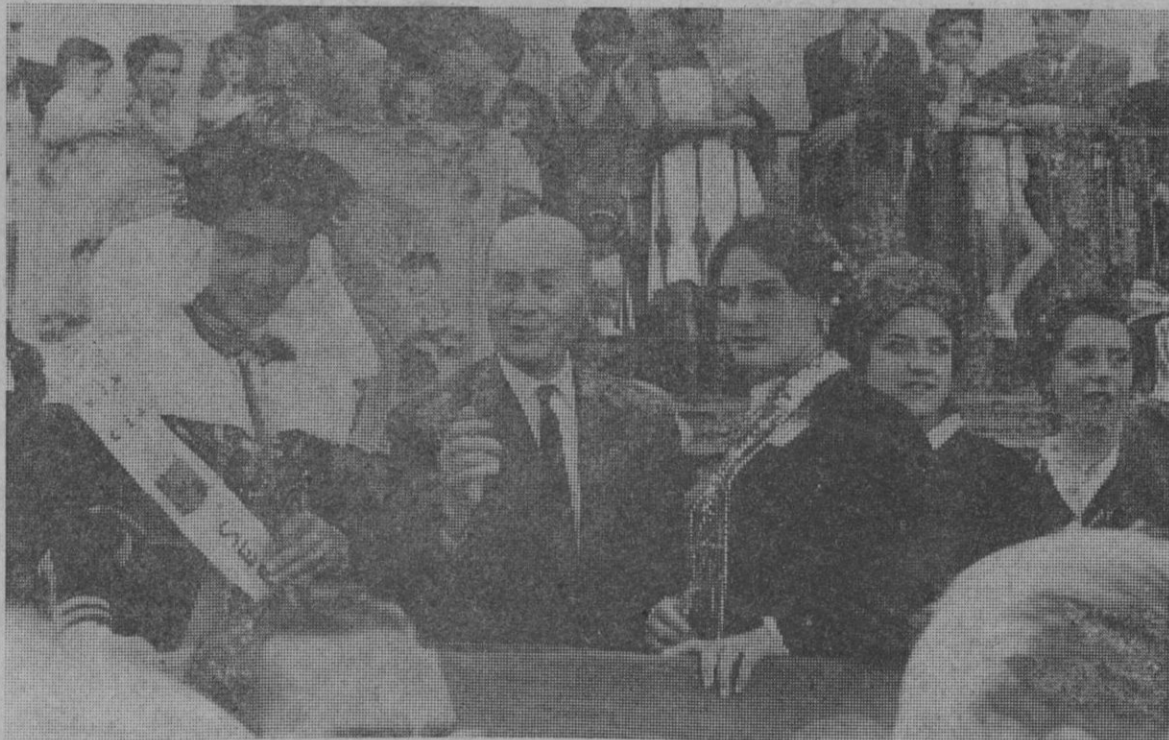
El gobernador civil, don Juan Murillo de Valdivia, acompañado de la Reina del Día de la Provincia y algunas de sus damas de honor, en un momento de la entrega de premios a las carrozas engalanadas, dentro de los actos celebrados ayer en Sepúlveda.

El matrimonio se muestra contentísimo ya que, al margen de sus nuevas preocupaciones económicas, estas tres criaturas les mitigarán el dolor que les produjo la muerte del único hijo que tenían.—Cifra.