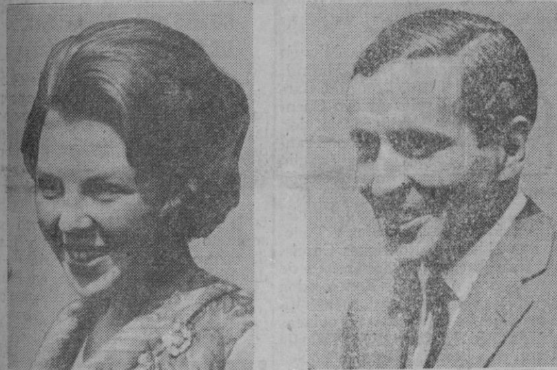
La princesa Beatriz de Holanda y su prometido el diplomático alemán Klaus von Amsberg

La Haya, 1.—El diario católico holandés «De Volkskrant», indica, en su número de hoy, que la princesa Beatriz, heredera del trono de Holanda, y su novio Klaus von Amsberg, de Alemania occidental, contraerán matrimonio, a primeros de febrero, en Amsterdam.