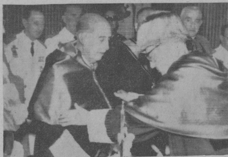
Su Excelencia el Jefe del Estado, en el momento de recibir la investidura de doctor "honoris causa" en Ciencias por la Universidad de Santiago de Compostela, en solemne sesión académica. El decano de la Facultad impone al Caudillo la muceta de doctor.

Alicante, 30.—A primera hora de la madrugada se observó en el cielo, sobre la playa de la Albufera, un objeto brillante y fijo, que llamó la atención de las numerosas personas que a esas horas regresaban a la ciudad en automóvil, de los lugares próximos.—Cifra.