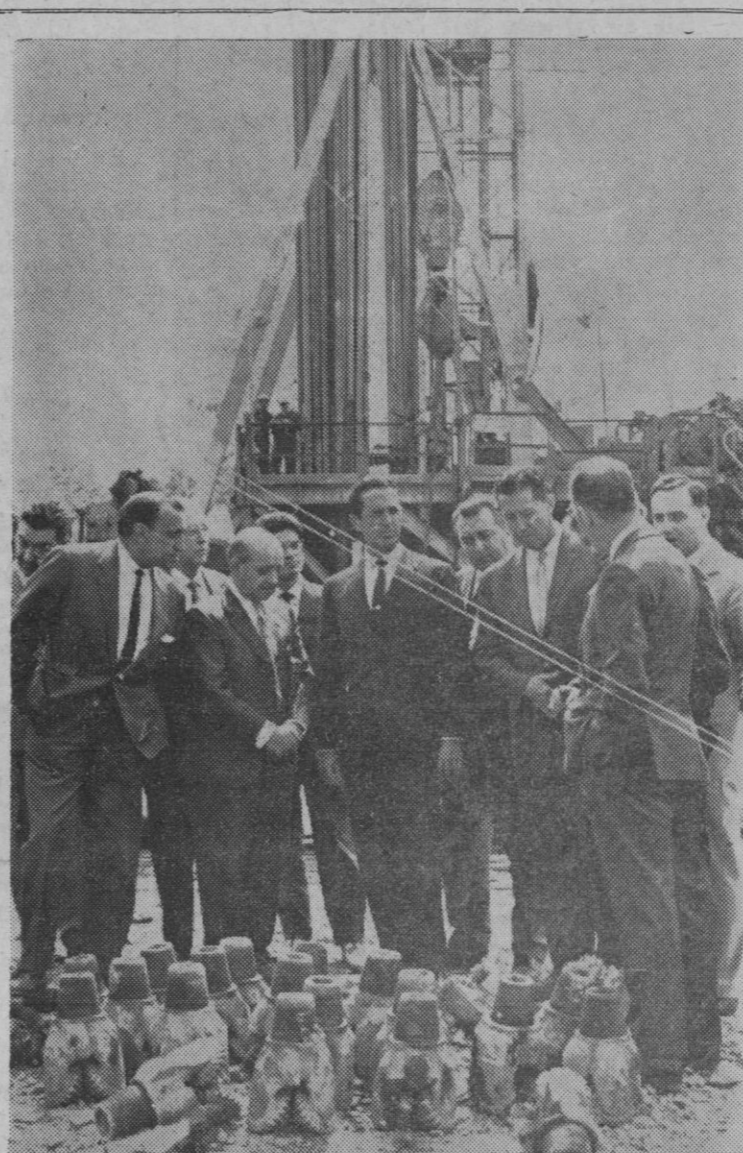
El ministro de Industria, don Gregorio López Bravo, acompañado del director general de Minas, autoridades locales y altos directivos de las compañías explotadoras, durante su visita al pozo de "El Tozo", Burgos, el más prometedor de los horadados hasta ahora en la provincia burgalesa.

Londres, 12.—El primer ministro británico, Harold Wilson, ha declarado que Gran Bretaña acogería con gran satisfacción una propuesta norteamericana para celebrar una conferencia internacional destinada a mejorar el sistema monetario mundial.