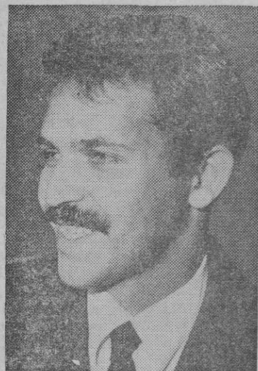
Abdelaziz Bouteflika, ministro argelino de Negocios Extranjeros, que ha permanecido en su puesto después del reciente golpe de estado realizado por Bumedian.

Argel, 12.—El coronel Huari Bumedian ha presidido hoy la primera sesión del nuevo gabinete argelino, formado bajo su mando el pasado sábado. La primera sesión del gabinete ha sido abierta en el palacio presidencial argelino, escoltada por una guardia de honor de Spahis con capas verdes y turbantes.