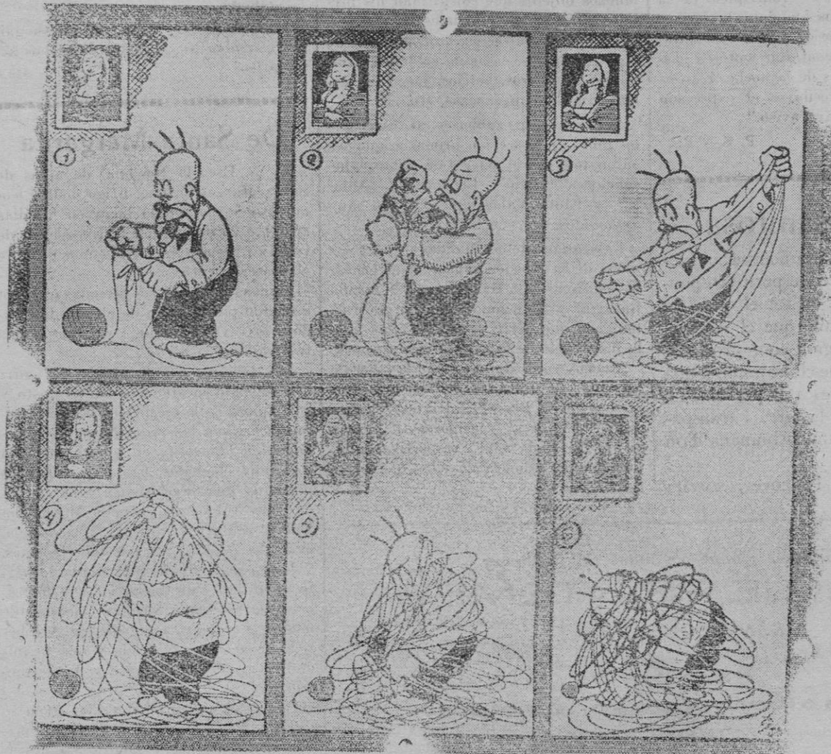
Adamson «arregla» un ovillo de hilo