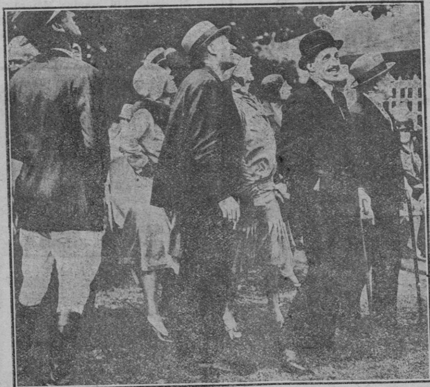
Su Majestad el Rey Alfonso XIII, el Duque de Miranda y otras personalidades contemplando los vuelos de los aviones, a su llegada a San Sebastián

Por causas ajenas a la voluntad de esta Compañía, se suspende, hasta nuevo aviso, el tren eléctrico que tenía su salida de Palma a las 11'30 y de Sóller a las 13'30.—La Dirección.