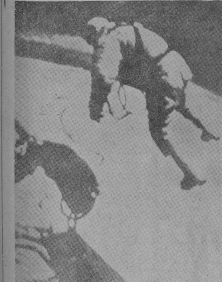
Cabo Kennedy.—Esta fascinante fotografía realizada por el astronauta norteamericano James McDivitt desde la cápsula espacial "Gemini 4", recoge el instante en que su compañero Edward White abandona la cápsula espacial. La fotografía ha sido distribuida por la N. A. S. A.