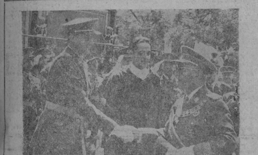
El jefe del Estado saluda al príncipe don Juan Carlos, a su llegada a la tribuna desde donde presenciarán el desfile del XXVI aniversario de la Victoria, en Madrid. Se halló presente también el príncipe Muley Abdalah, hermano del Rey de Marruecos.

La emisora agregó que todas las detenciones habían sido efectuadas por las autoridades policiales de la provincia de Camagüey.—Efe.