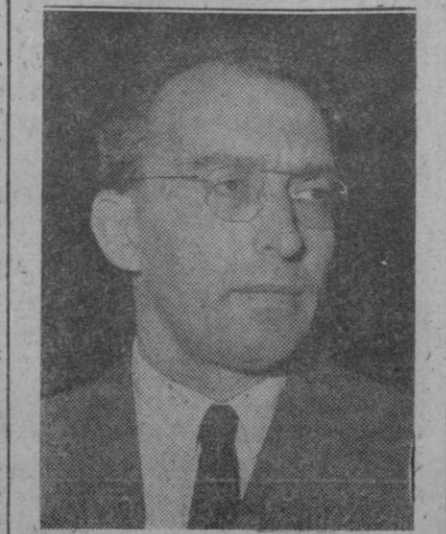
Marko Nikezic, que ha sido nombrado ministro de Negocios Extranjeros de Yugoslavia