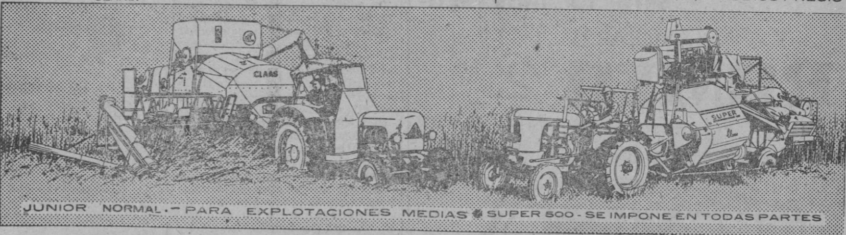
JUNIOR NORMAL.— PARA EXPLOTACIONES MEDIAS • SUPER 800.— SE IMPONE EN TODAS PARTES

La razón de esta preponderancia se basa en tres cualidades principales de CLAAS: rendimiento, economía y seguridad. Y un extraordinario servicio post-venta, que cuenta en España con equipos técnicos y un stock total de repuestos para atender en cualquier lugar las necesidades de los usuarios y garantizar el perfecto funcionamiento de todos y cada uno de los modelos de cosechadoras CLAAS.