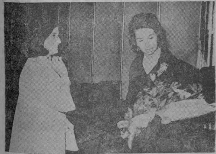
En el cine Carlos III, de Madrid, y en función de gala ha sido proyectada la película «Tres perfiles de mujer», de la que es intérprete la exemperatriz Soraya de Persia. Al acto asistieron la princesa Sofía y la marquesa de Villaverde.

Temperaturas extremas de España: máxima de 26 grados en Huelva, Sevilla y Murcia. Mínima de cuatro grados en Avila, Burgos, León y Salamanca.—Cifra.