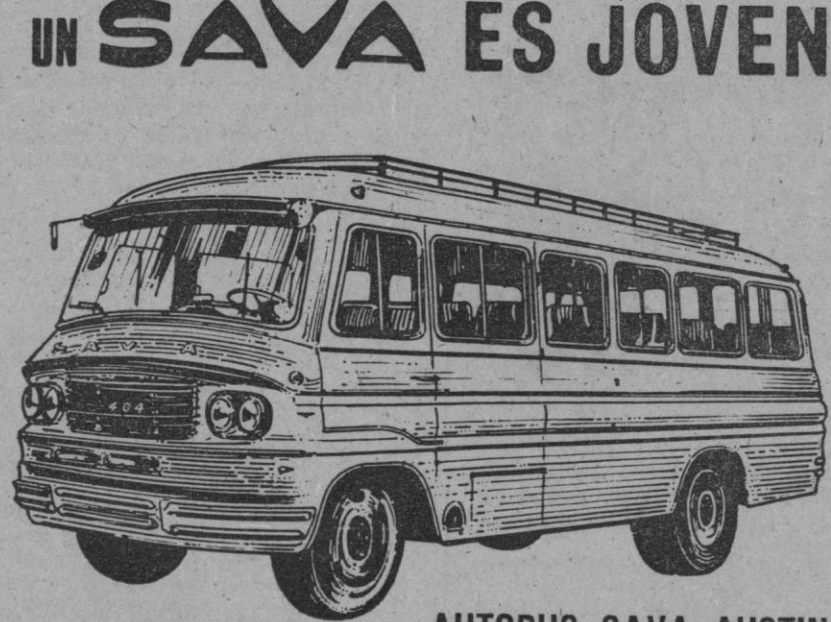
AUTOBUS SAVA AUSTIN MODELO-404-A NUMERO DE PLAZAS: 23/25 + CONDUCTOR

Equipado con motor de 3.770 cm 3 77 CV. Caja de cambios y reductora, 8 velocidades adelante y dos marchas atrás; neumáticos 7,00 x 20