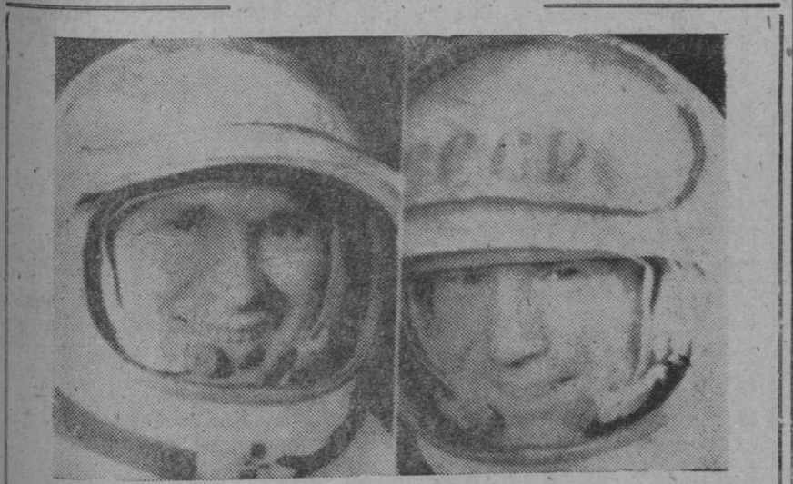
Moscú.—El coronel soviético Pavel Belyaef (izquierda), comandante de la cápsula espacial "Vostok II", y el segundo piloto de la nave, teniente coronel Alexei Leonof. Este último fue quien salió de la nave y volvió a ella inánime.

Moscú, 23.—Los cosmonautas soviéticos, Pavel Belyaef y Alexei Leonof, que han llevado a cabo una experiencia espacial histórica el pasado jueves, han llegado por vía aérea a Moscú, con objeto de recibir una entusiástica bienvenida de los habitantes de la capital soviética.—Efe.