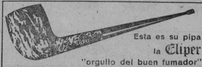
Esta es su pipa la Cliper "orgullo del buen fumador"