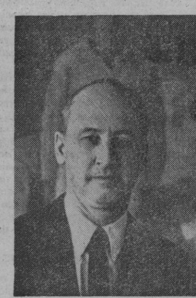
Washington.—El nuevo embajador de los Estados Unidos en España, Mr. Angier Biddle, desembarcará en Algeciras el próximo día veintinueve, acompañado de su familia. En la foto el nuevo embajador con su esposa.

En su sermón se ha referido a la ola de laicismo que nos invade, que llega a borrar el nombre y la presencia de Jesucristo en el mundo. Su Santidad ha recordado que las mismas «puertas de la Iglesia de Roma» no se ven libres de la influencia de las modernas desviaciones del pensamiento. El Papa, al parecer, se refería a las recientes polémicas surgidas entre el Estado italiano y la Iglesia con motivo de la representación de cierta obra de teatro prohibida en Roma recientemente y de ciertas películas moralmente reprochables.—Efe.