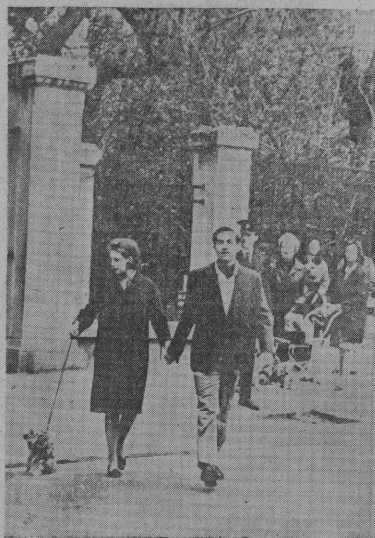
Atenas.—Este joven matrimonio, que espera un hijo, pasea por las calles de esta ciudad, la mano con la mano, como tantas parejas de todo el mundo. Sin embargo, esta pareja es de excepción: se trata de los reyes de Grecia, Ana María y Constantino, a quienes tal vez no hayan reconocido. En la foto, los monarcas de los griegos han sacado a pasear al perro de la reina, llamado Lopsy, idéntico al que posee el rey, llamado Topsy.