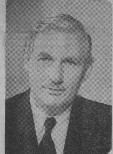
Marcus Wallenberg, el financiero sueco que ha sido elegido presidente de la Cámara Internacional de Comercio

La cantidad mencionada se distribuye entre las secciones de Crédito de Hermandades de Labradores y Ganaderos, Grupos Sindicales de Colonización, entidades colaboradoras e industrias agrarias de varias provincias españolas.