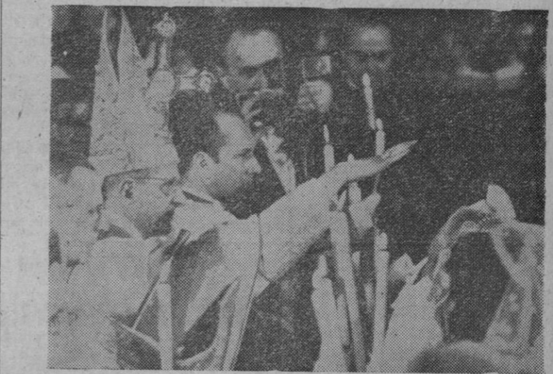
Un momento de la solemne ceremonia celebrada en la basílica de San Pedro, en Roma, en la que Su Santidad el Papa Pablo VI bautizó y confirmó a doce conversos congoleños, seis hombres y seis mujeres.

Visitó detenidamente varias de ellas, una de las cuales ya está en pleno período de funcionamiento y otras se encuentran en condiciones de comenzar a funcionar en breve tiempo. A la una de la tarde, el ministro regresó a su despacho oficial y, por la noche, emprenderá viaje de regreso a Madrid.