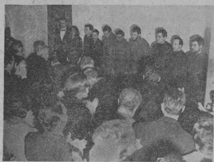
Una escena de "El Vicario", de Hochstet durante la representación clandestina en un piso de la librería Feltrinelli, de Roma. Como se sabe, las autoridades italianas prohibieron la representación en público de esta obra, prohibición con la que parece relacionada el insólito y cobarde atentado cometido contra una puerta del Vaticano.

Casanova es miembro del Club Deportivo de Pesca de Lourenço Marques.—Efe.