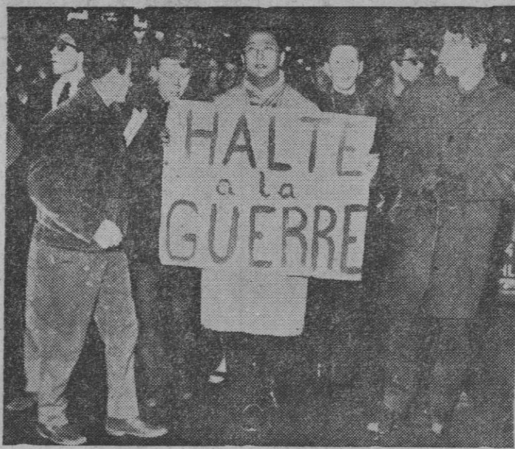
Una vista de la manifestación celebrada en París ante la Embajada de los Estados Unidos, en contra de las acciones aéreas de represalia contra el Vietnam del Norte. Apoyada por los comunistas franceses, los manifestantes chocaron con la policía, registrándose heridos por ambas partes y deteniendo la circulación en el barrio Concordia-Opera.—(Foto Fiel.)

El peluquero de Arón ha hecho el gran negocio. El hombre decía a sus convencidos: «Como veréis, después de pelaros y afeitaros como Dios manda, recuperaréis las fuerzas. Lo de Sansón no pasó en este pueblo.»—Efe.