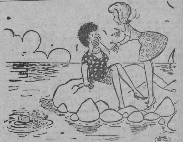
—Vamos, mamá, no dramáticas; papá no llevaba todo el dinero en su cartera...