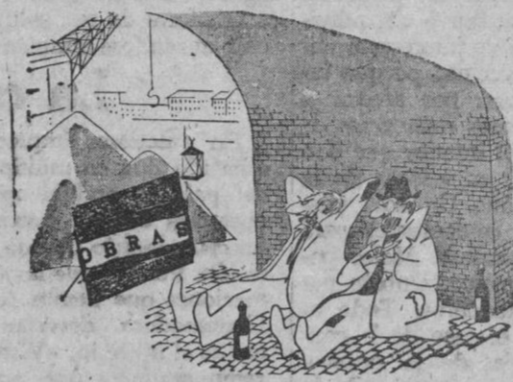
—Me fatiga ver ahí tanto tiempo ese cartel de "obras"

MEJOR QUE LA REALIDAD Distribuidor exclusivo CASA SOLERA