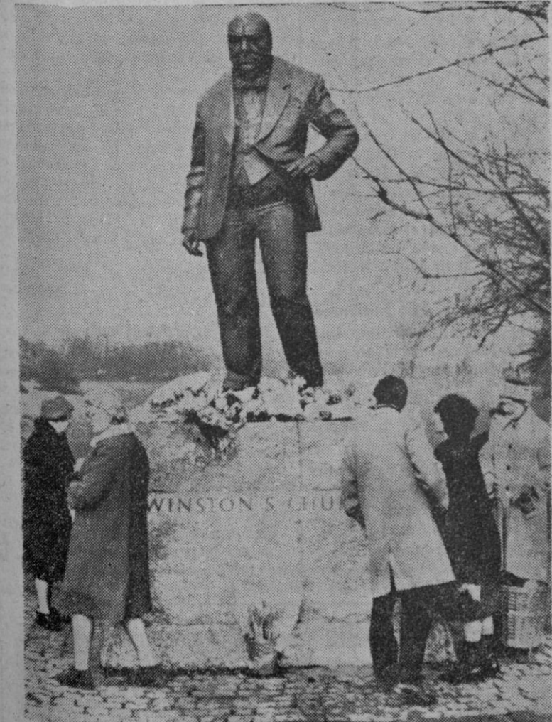
Desde que llegaron las primeras noticias del fallecimiento, la estatua de sir Winston Churchill levantada en Woolford, el distrito electoral que representó durante su larga vida parlamentaria, es cubierta diariamente de flores por sus antiguos electores.

«Por ser inhábil el 31 de enero, el plazo de presentación de solicitudes para la instalación de nuevas industrias en los polos de promoción y de desarrollo se entenderá extendido hasta el día 1 de febrero del presente año, a las doce de la noche, de acuerdo con el número 3 del artículo 60 de la ley de procedimiento administrativo de 17 de julio de 1958».—Cifra.