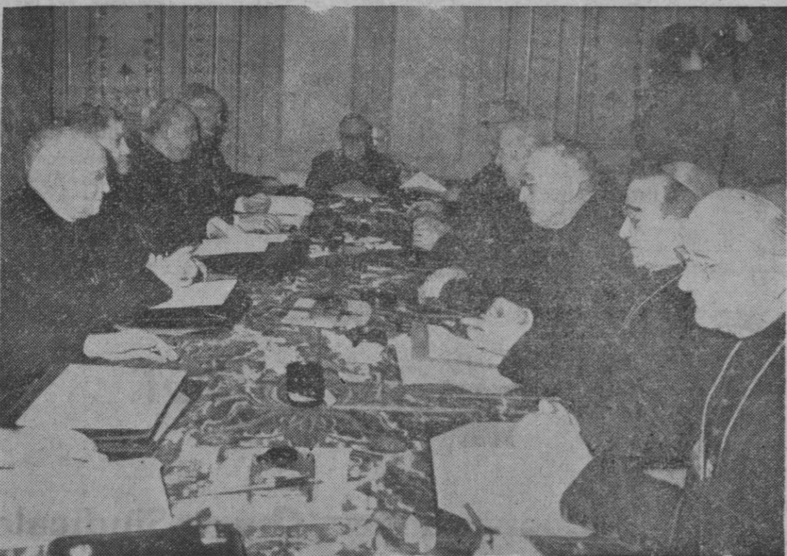
El cardenal primado, doctor Pla y Deniel, presidiendo una de las reuniones de la Conferencia de Metropolitanos españoles, en el Palacio de la Cruzada, de Madrid, a la que han asistido todos los cardenales y arzobispos de España.—(Foto Fiel.)

Madrid, 29.—Esta noche ha terminado la conferencia de metropolitanos que durante tres días se ha venido celebrando en el Palacio de la Cruzada, presidida por el arzobispo primado de Toledo, cardenal Pla y Deniel, y a la que han asistido la totalidad de los arzobispos españoles.