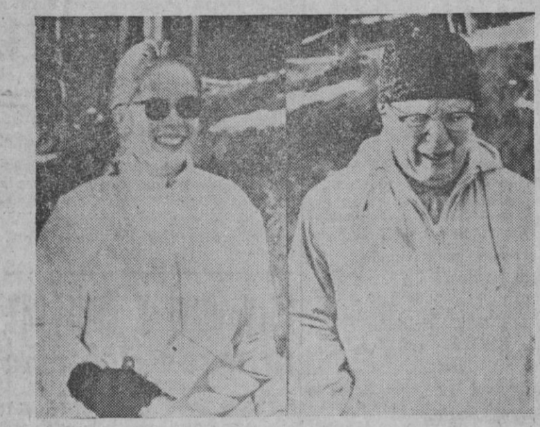
El famoso Charles Chaplin y su esposa Oona, están pasando unas vacaciones en Crans sur Sierre (Suiza). Charlot descansa del largo trabajo ocasionado por la aparición de sus memorias. En la foto la pareja paseando por las calles de la estación de Montana.

El secretario manifestó después a los periodistas que el mensaje de Su Santidad dirigido a lady Churchill expresa el interés y la preocupación personal del Papa, así como el ofrecimiento de sus oraciones, en momento tan difícil, para el ilustre estadista.