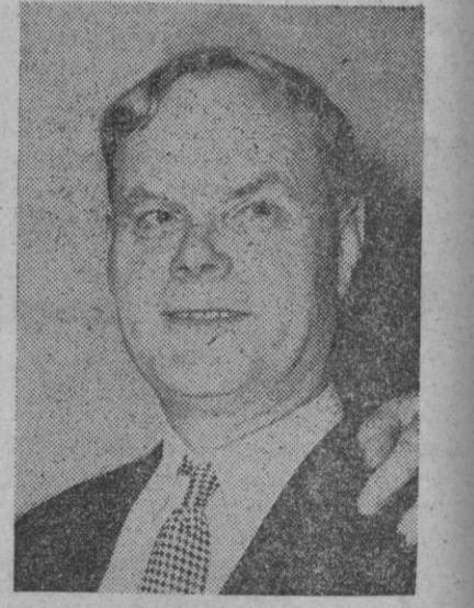
Patrick Dean, nombrado embajador británico en Washington

Este equivale en definitiva a un dramático llamamiento del Vaticano contra la amenaza comunista en Italia. Queda por ver si tal llamamiento será escuchado o no por quienes se empeñan en profundizar cada vez más las diferencias que separan a las distintas corrientes de la Democracia Cristiana y de las que obtiene innegables ventajas el partido comunista.