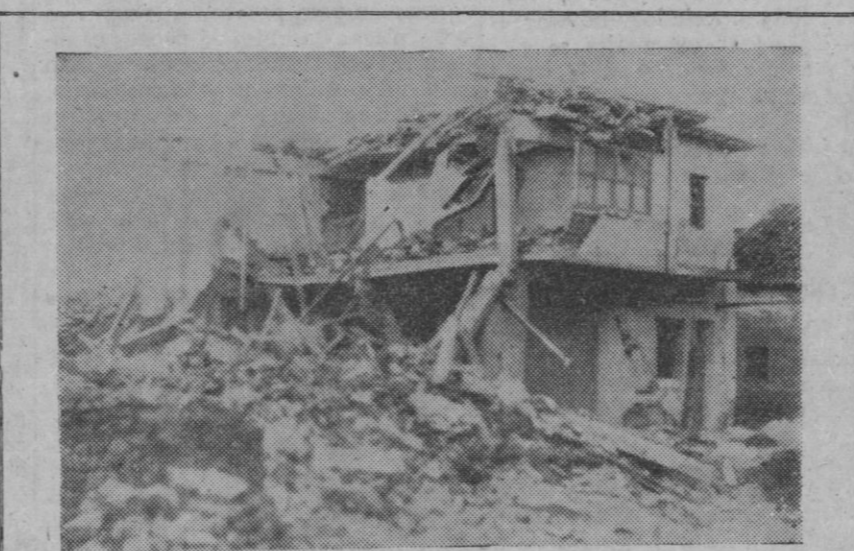
Como esta casa han quedado muchas en el pueblo de Reocin, Santander, tras el movimiento de tierras producido por el hundimiento de la mina de cinc allí existente y que es la más importante de España