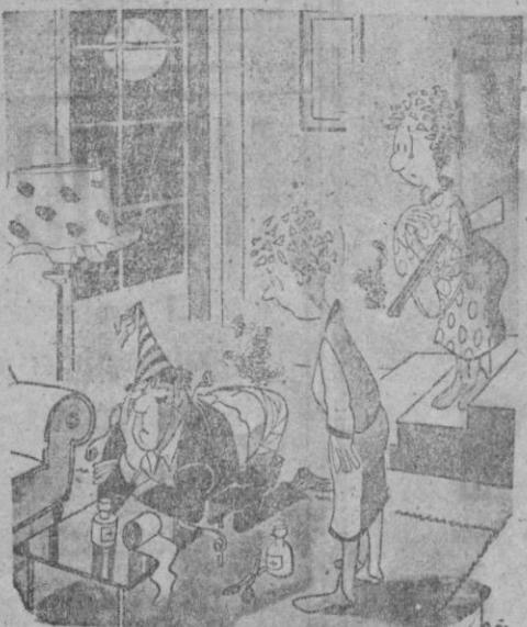
—A la hora que has regresado pensábamos que era un ladrón...

MEJOR QUE LA REALIDAD Distribuidor exclusivo CASA SOLERA