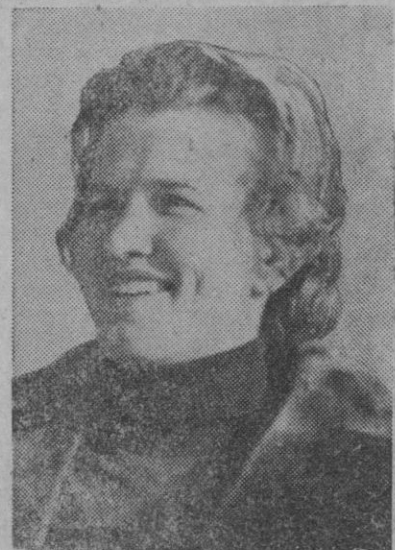
Lidia Skoblikova, la palinadora soviética que ha sido nombrada primera deportista del año en la U. R. S. S.

Desde bastante antes de las doce, hora señalada para la ceremonia se congregaron en la plaza del Carmen,