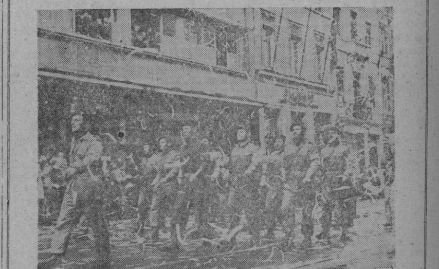
Los paracaidistas belgas que tomaron parte en la reciente operación de rescate de rehenes en el Congo, desfilan por las calles de Bruselas, envueltos en el «confetti» que les arroja la multitud a su regreso a la patria.

Agrega que en víspera de la llegada del jefe del Gobierno británico, Harold Wilson, a Washington, los Estados Unidos han informado al Gobierno británico que su plan para el mando nuclear del Atlántico es inaceptable.—Efe.