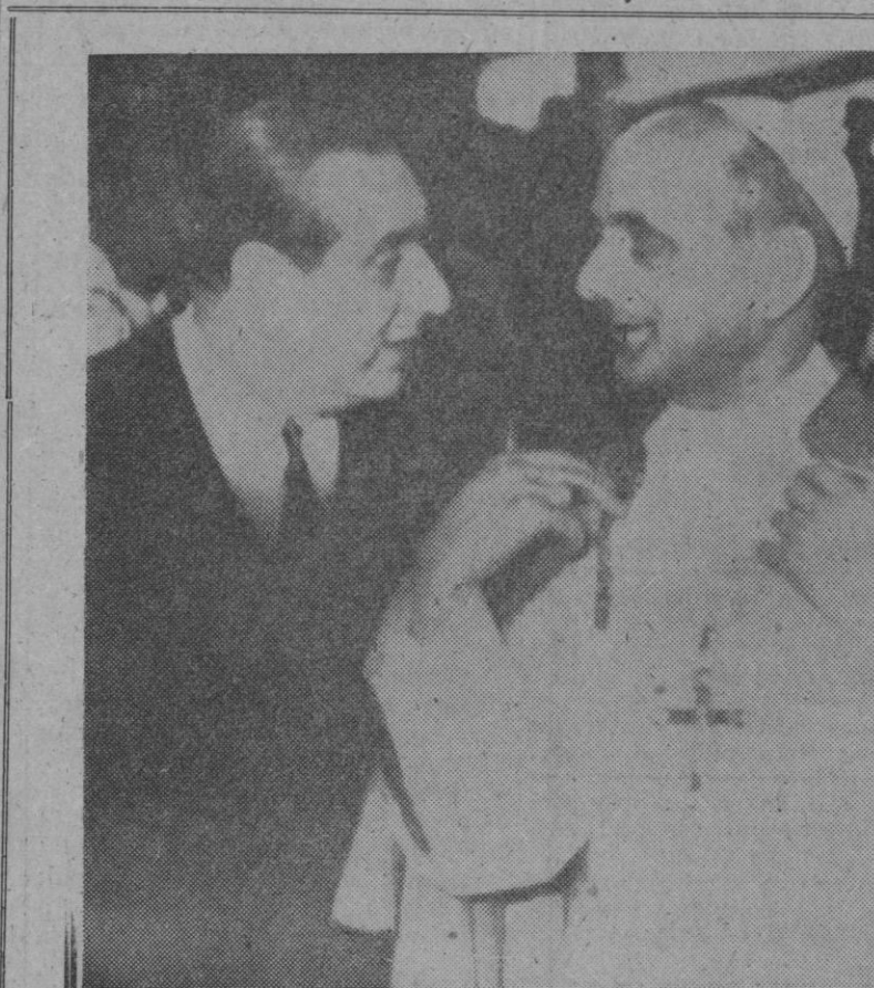
Su Santidad el Papa, Pablo VI, conversa con el presidente del Líbano, en el aeropuerto de Beirut, durante la escala del avión en aquella población, durante su reciente viaje a la India.