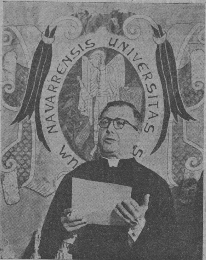
Monseñor Escrivá dirigiendo la palabra en la Universidad de Navarra

Doce mil «Amigos de la Universidad» reunidos en Pamplona en torno al Gran Canciller, Monseñor José María Escrivá