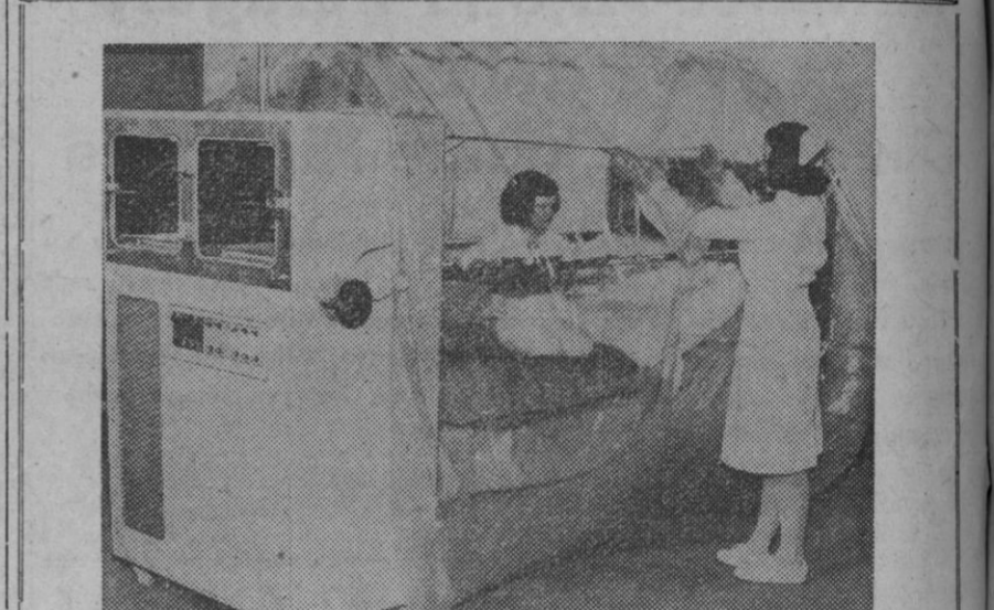
Este nuevo sistema de aislamiento para pacientes, crea un ambiente bacteriológicamente puro. Concede al enfermo una completa libertad de movimiento, y al personal médico gran libertad para seguir el tratamiento. Llamada "isla de la vida", está siendo probada actualmente en el Walter Reed Institute of Research, de Washington. Guantes especiales permiten el acceso a cualquier parte de la cámara, y los materiales pueden ser introducidos a través de llaves de aire, donde los rayos ultravioleta destruyen cualquier bacteria. El equipo pesa unos doscientos veinticinco kilos

Tendrán que pasar varios días antes de que los técnicos encargados de esta ambiciosa operación puedan determinar si efectivamente el «Mariner-3» ha alcanzado los 3500 millones de millas, desde cuya posición podrá seguir la trayectoria que le ha de llevar lo suficientemente cerca de Marte para realizar su misión y acaso descubrir la verdadera naturaleza de los célebres «canales».—Efe.