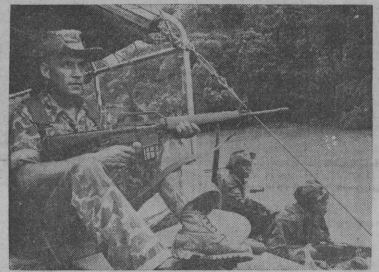
Un consejero militar norteamericano (izquierda) acompaña a algunos soldados del Ejército vietnamita, cuando éstos cruzan un río en el Vietnam del Sur, en busca de los guerrilleros del Vietcong. Los Estados Unidos han aumentado su ayuda al pueblo de la República del Vietnam, en su lucha contra las fuerzas comunistas.

equipos. Un crédito oficial a bajo interés y cómodo plazo de amortización, hasta el 70 por ciento de todas las inversiones proyectadas. Otro crédito suficiente para la adjudicación del ganado y disponibilidad del capital circulante que necesita la asociación. Reducciones importantes o desgravaciones totales de muy diversa índole, así como preferencia para expropiaciones de terrenos, pastos para los ganados, líneas de transporte de energía eléctrica y abastecimiento de agua, etc.—Cifra.