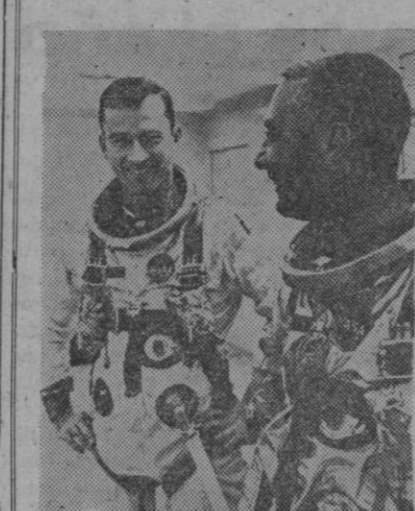
Cabo Kennedy (Florida).—He aquí a los dos astronautas, Virgil I. Grisson (derecha) y John W. Young, piloto y copiloto respectivamente, que tripularán la nave dirigida "Gemini", cuyo lanzamiento se efectuará a primeros de mil novecientos sesenta y cinco. Ambos están vestidos con el traje espacial que portarán en el vuelo. Ambos han sido retratados durante la conferencia de prensa ofrecida por la N. A. S. A.

Zaragoza: Aprobadas 54 solicitudes, por un valor de 1.566,4 millones de pesetas y que representan 4.574 nuevos puestos de trabajo. Aplazada la resolución de ocho solicitudes.