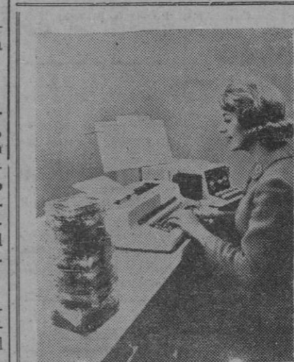
Esta mecanógrafa escribe en la nueva máquina eléctrica capaz de escribir sin ningún error y a una velocidad de ciento ochenta palabras por minuto, fabricada por IBM. A la izquierda, las cintas magnéticas que almacenan la información mecanografiada en forma codificada.

«Nos complace —continúa el articulista— que el alcalde Wagner y el gobernador de Nueva York, Rockefeller, estén comentando a reconocerlo con proclamaciones oficiales, pero seríamos aún más felices si los italianos se rindiesen a la verdad y cesaran de atribuirse la gloria del descubrimiento que corresponde a la madre patria».—Efe.