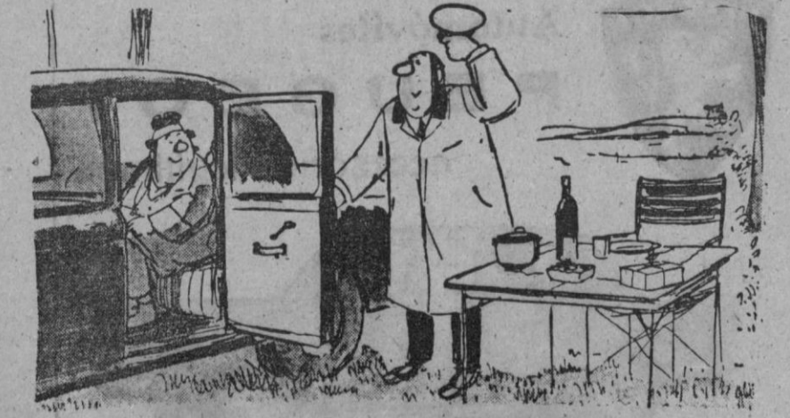
—¡La señora está servida...!