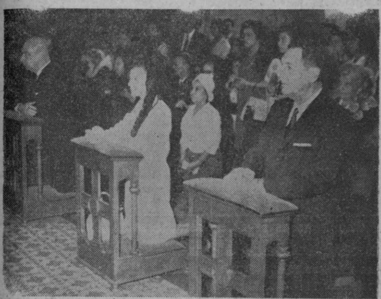
El ex presidente argentino Juan Domingo Perón y su esposa Isabel, rezando de rodillas durante el funeral celebrado en la iglesia de la Buena Dicha, de Madrid, por Eva Perón, en el XII aniversario de su muerte. Asistieron también numerosos amigos y compatriotas del ex presidente.—(Foto Fiel)

El paso del Caudillo por las calles donostiarres fue acogido por los transeúntes con cariñosas muestras de afecto y simpatía.—Cifra.