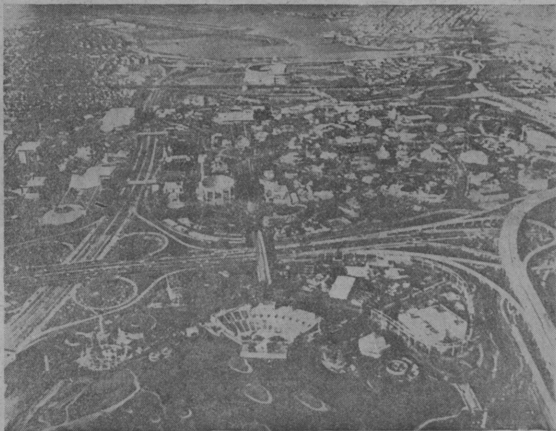
Nueva York.—He aquí una fantástica vista aérea del recinto de la Feria Mundial de esta ciudad y que está ya prácticamente terminada. La Feria será inaugurada dentro de unos meses y en ella España exhibe un magnífico pabellón.—(Foto Europa Press.)

Durante todo su recorrido, el Rey fue aclamado por el público, a lo que correspondió el Monarca saludando sonriente con la mano.—Efe.