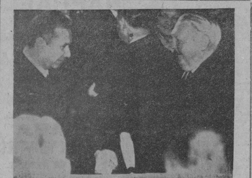
Roma.—El canciller de la República Federal Alemana, Ludwig Erhard, ha celebrado en esta ciudad importantes conversaciones. En la telefoto, el canciller alemán es saludado por el primer ministro italiano, Aldo Moro.