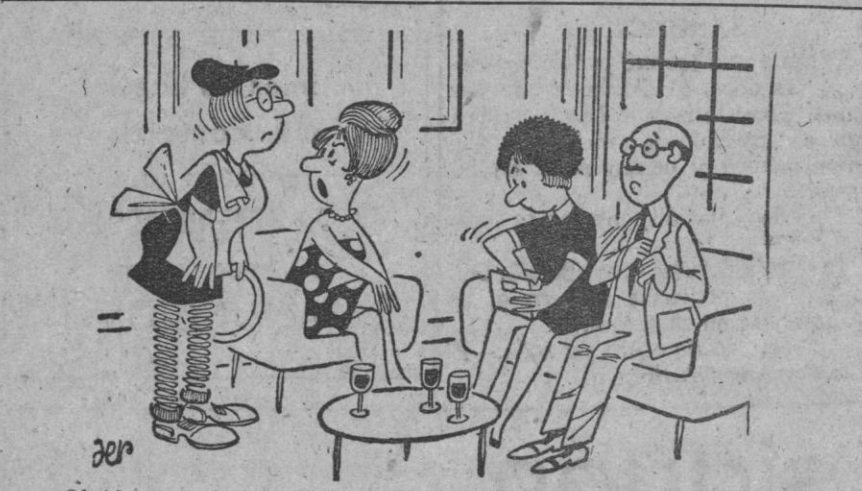
—Ovídense ya de la cafetería; son mis invitados y no hay que cobrarles la consumición.