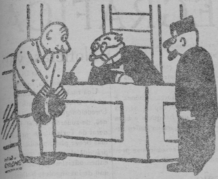
Y por qué ha hecho usted estos billetes falsos de mil francos? Porque no sé hacerlos buenos.