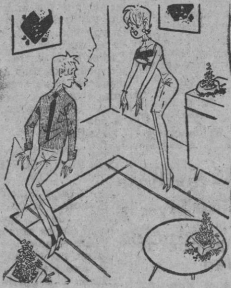
—Mira, ceniza sobre la alfombra. ¿Para qué me molesto en poner cenizas por todas partes?