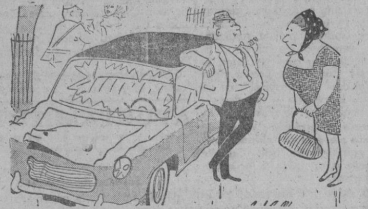
—El coche tiene para mí muchos recuerdos: El parabrisas, Burgos; el faro derecho, Madrid; los amortiguadores, la avenida de José Antonio, de Segovia...

27 pulgadas El televisor más grande del mundo Casa Solera