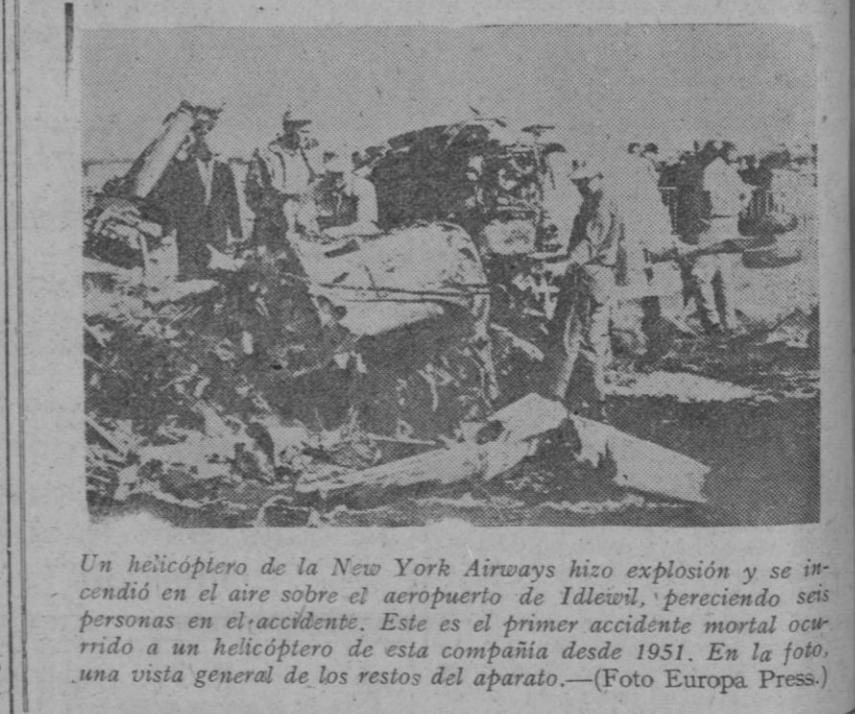
Un helicóptero de la New York Airways hizo explosión y se incendió en el aire sobre el aeropuerto de Idlewild, pereciendo seis personas en el accidente. Este es el primer accidente mortal ocurrido a un helicóptero de esta compañía desde 1951. En la foto, una vista general de los restos del aparato.