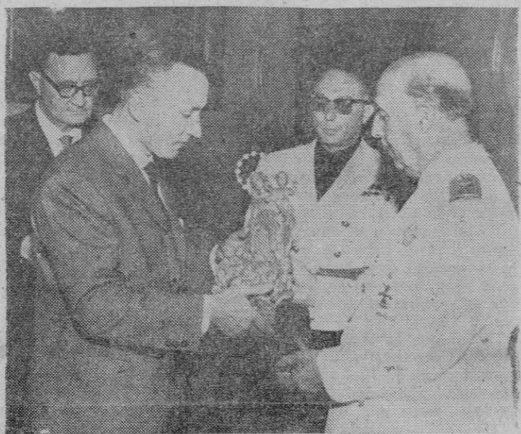
En el Pazo de Meirás, el patrón mayor de la Cofradía de Pescadores de la villa de Cedeira, hace entrega a Su Excelencia el Jefe del Estado de una magnífica talla en boj, reproducción de la Virgen del Mar, Patrona de dicha villa y muy venerada por toda la comarca