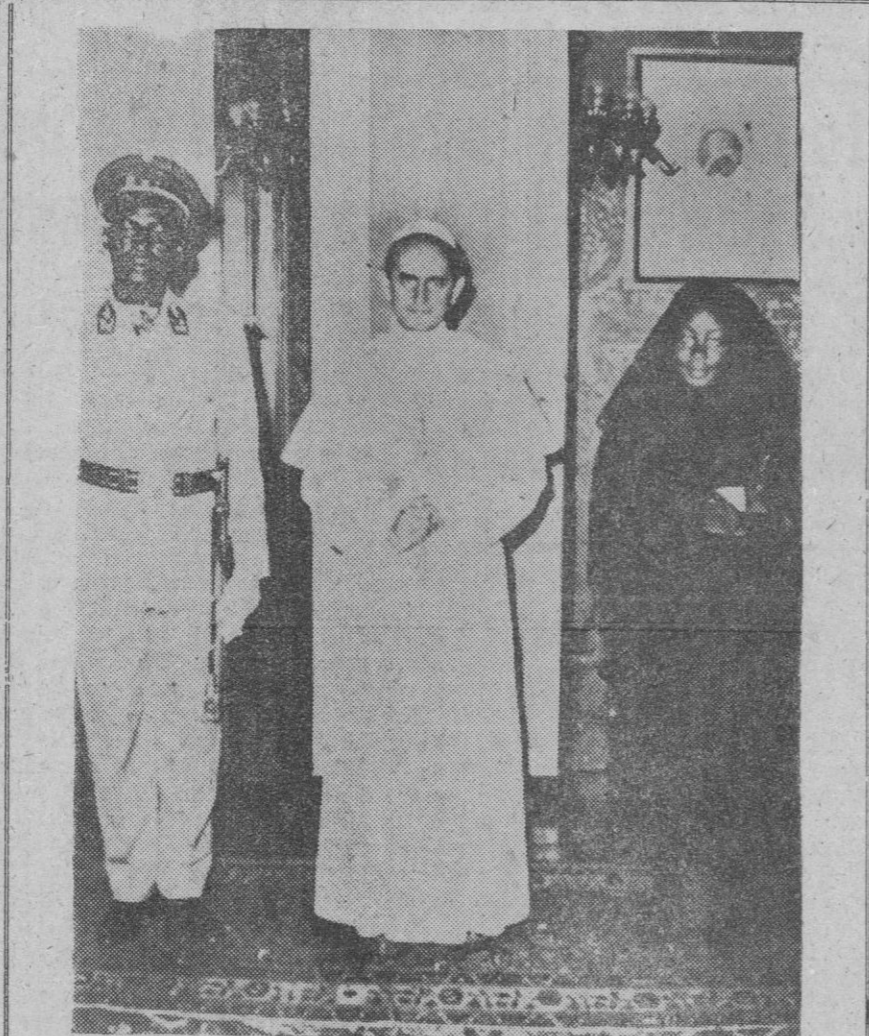
Su Santidad el Papa Pablo VI, ha recibido en audiencia especial, en Castelgandolfo, al jefe del Estado Mayor del Congo, coronel Mobutu, a quien acompañaba su esposa.

La Coruña, 16.—El vicepresidente del Gobierno, capitán general Muñoz Grandes; el ministro de Asuntos Exteriores, señor Castiella, y el embajador de España en Washington, señor Garrigues, han llegado a esta capital por vía férrea.—Cifra.