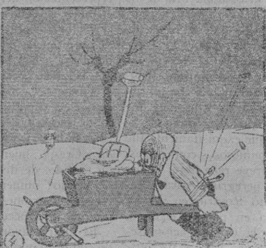
Adamson descubre que tiene un nuevo freno de seguridad.