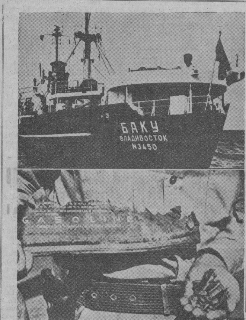
Recientemente fue atacado por un comando antifidelista que tripulaba una lancha rápida el mercante ruso "Baku", cuando navegaba cerca de Cayo francés, en la costa norte de la provincia de Las Villas. En la foto, arriba, el "Baku" en La Habana, reparando las averías provocadas por el ataque. Abajo, fragmentos de la mina que los antifidelistas arrojaron contra el barco.