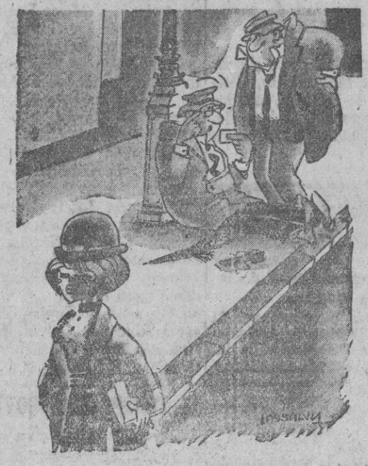
—Mira, nos ha dejado su tarjeta de visita: "Lucía Ramos, cinturón negro de judo"...