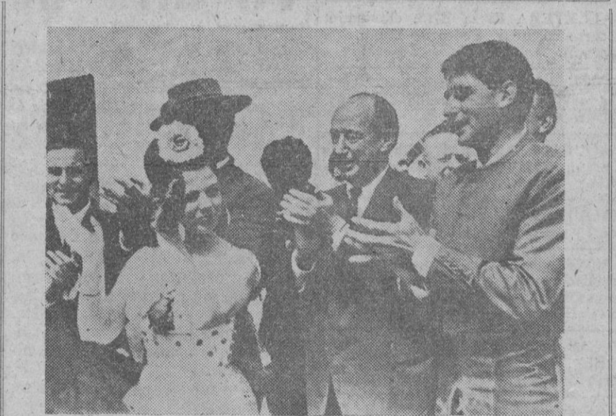
Durante su reciente estancia en Sevilla, el delegado permanente de los Estados Unidos en las Naciones Unidas, Adlai Stevenson, acudió a una fiesta campera que le ofrecieron los rejoneros hermanos Peralta, en su finca. En la foto, Stevenson y sus acompañantes baten palmas con entusiasmo junto a las buenas mozas andaluzas.

París, 19.—El Consejo municipal de París ha decidido dar el nombre del poeta español Federico García Lorca a la plaza parisina situada en el distrito de Assy, que hasta ahora se llamaba plaza de Rodin.