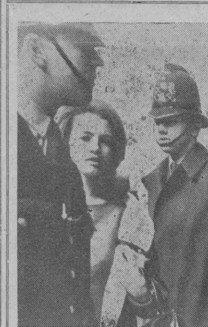
Christine Keeler, la joven modelo de veinte años, explicó por medio de su abogado ante el tribunal, las razones de no haber comparecido durante tres semanas. La modelo, en la foto, al salir de dicho tribunal