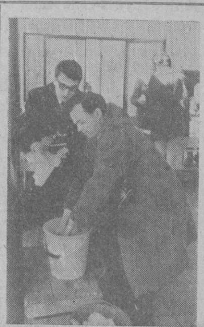
En Zermatt, dos fotógrafos que habían visitado el hospital, donde se hallaban los afectados del tifus, cumplen con los requisitos de limpieza ordenada; para evitar la propagación de la epidemia.