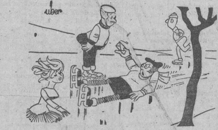
—Es la última vez que le traigo aquí un telegrama!