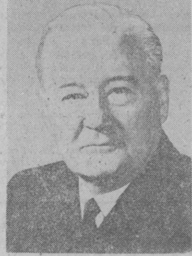
El almirante Harold Page Smith, jefe de la Flota norteamericana en Europa...

el sistema de submarinos con proyectiles «Polaris» facilita a Estados Unidos una potencialidad de la que carecía el pasado año.