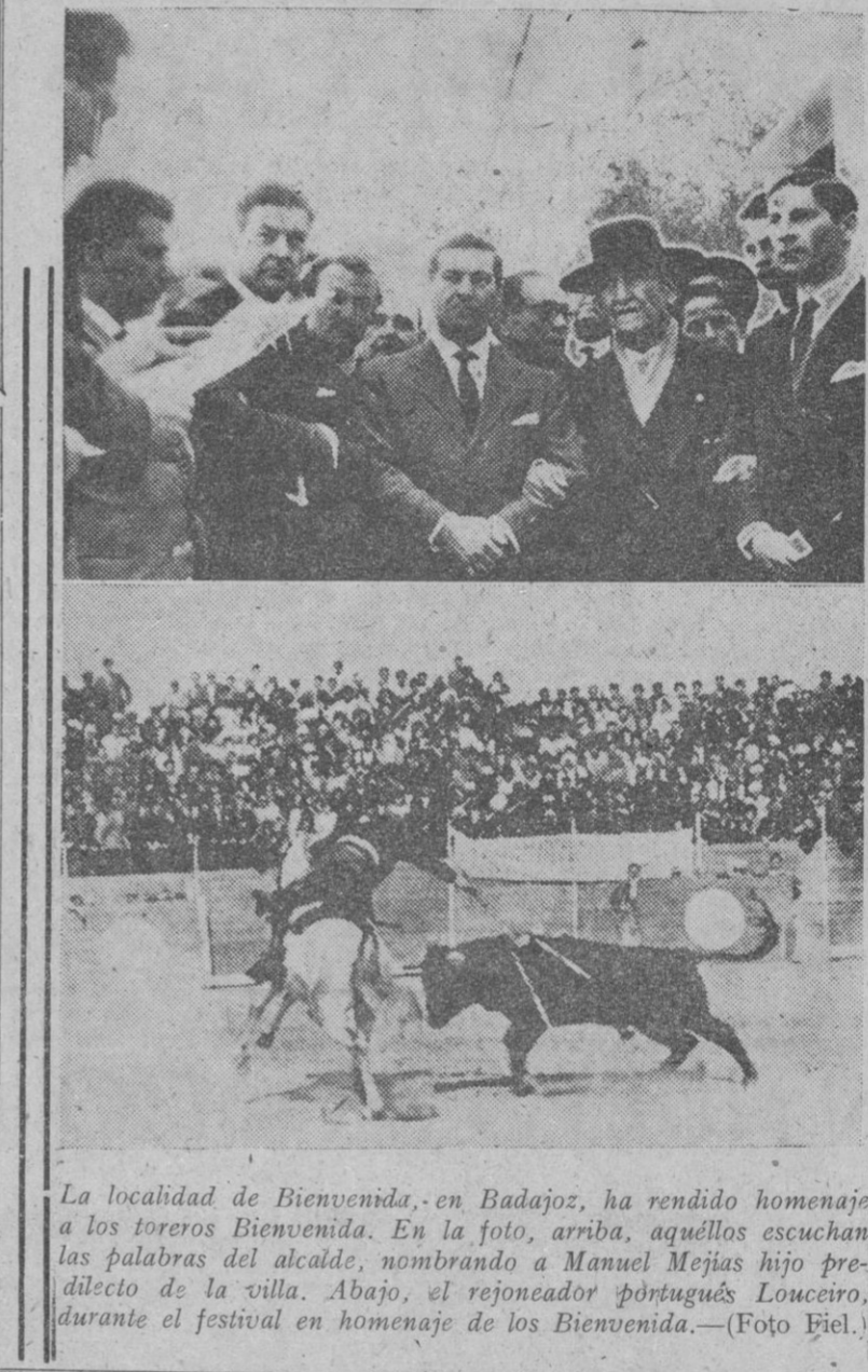
La localidad de Bienvenida, en Badajoz, ha rendido homenaje a los toreros Bienvenida. En la foto, arriba, aquellos escuchan las palabras del alcalde...