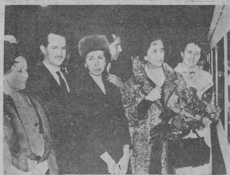
La esposa del Caudillo, doña Carmen Polo de Franco, durante su visita a la exposición «Oro del Perú», acompañada del jefe de la Casa Civil, la esposa del ministro de la Gobernación y el director general de Bellas Artes.

Se espera que las manifestaciones tengan lugar antes del mes de mayo, pues uno de los mayores deseos de sus organizadores es que coincida con el apogeo de la campaña electoral.