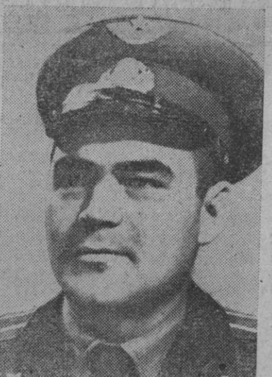
El teniente coronel Popovich (a la izquierda) y el comandante Nikolayev, que recientemente han girado en órbitas simultáneas alrededor de la Tierra en las últimas naves espaciales lanzadas por Rusia