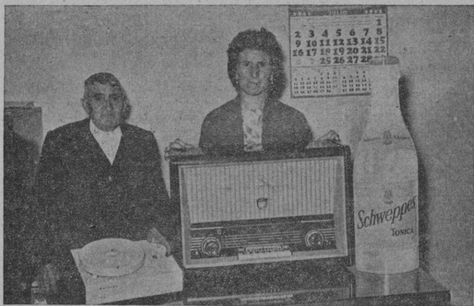
Momento de la entrega de un receptor y un tocadiscos PHILIPS en las oficinas de LA CASERA en nuestra capital