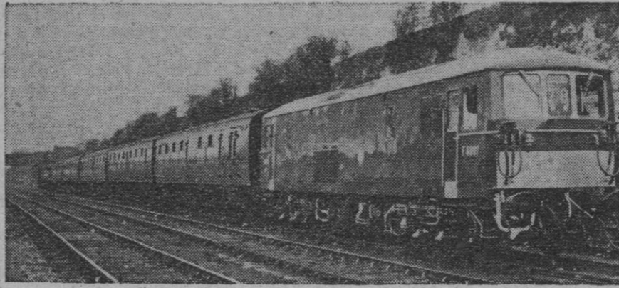
Pruebas de una locomotora Bo-bo, electro-diesel (arriba), destinada a los Ferrocarriles británicos, que puede funcionar con energía eléctrica o diesel, según se requiera. Esta máquina, emplea electricidad ad libitum y fuerza diesel cuando conviene. La mano derecha del maquinista está en el mando eléctrico (derecha), y la manivela inmediatamente debajo controla el motor diesel de 600 c. f. Puede funcionar eficientemente en líneas electrificadas, y seguir funcionando por vías no eléctricas.

Washington, 11.—El presidente Kennedy ha convertido en ley con su firma una disposición por la que se determina que los fabricantes de aparatos de televisión capaciten éstos para recibir por 82 canales diferentes.—Efe.