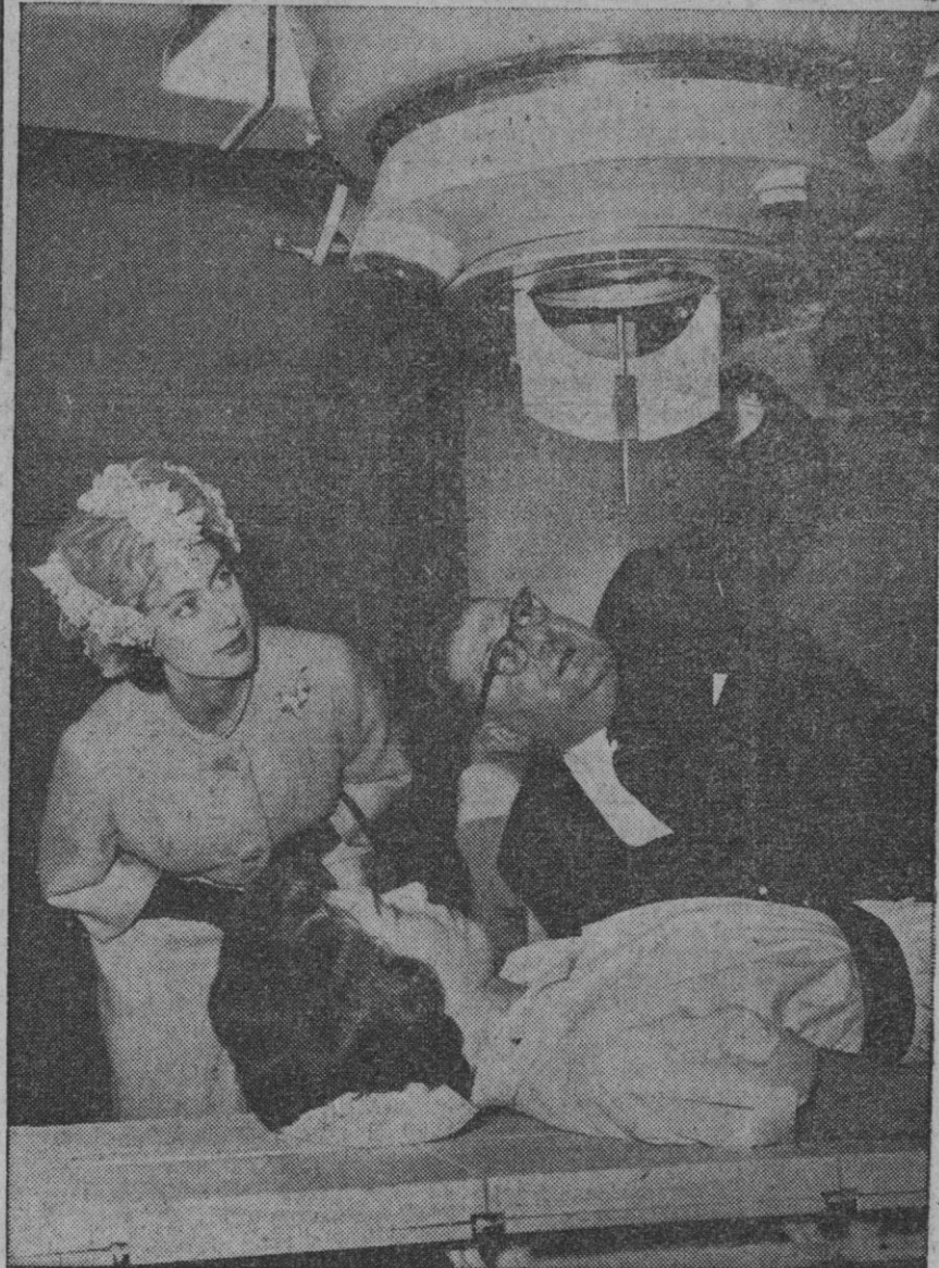
La princesa Margarita de Inglaterra realizó recientemente una visita oficial al Hospital de North Ormesby, en Middlesbrough, donde declaró inaugurada la instalación de terapéutica "Bomba de Cobalto", utilizada en el tratamiento contra el cáncer

Barcelona, 11.—Poca consistencia en Bolsa, con ausencia de dinero y mucha oferta de papel, ha sido la tónica de la última sesión de la semana.—Cifra.