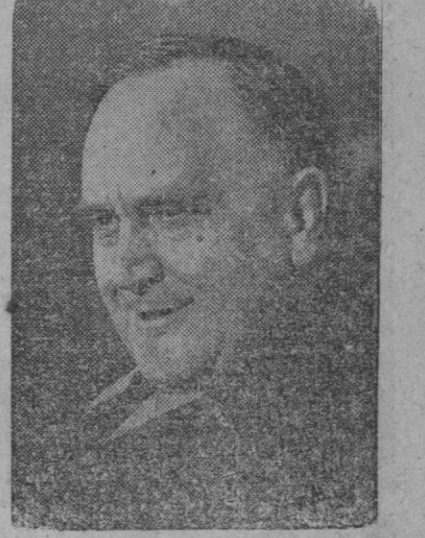
Sir Roy Valensky, primer ministro de Rodesia que, al parecer, ha firmado una alianza secreta con el primer ministro de Suráfrica, Verwoerd, y el jefe del Gobierno portugués, Antonio Salazar