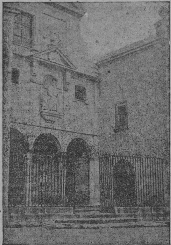
Fachada del convento de San José, conocido por "Las Madres", en Avila