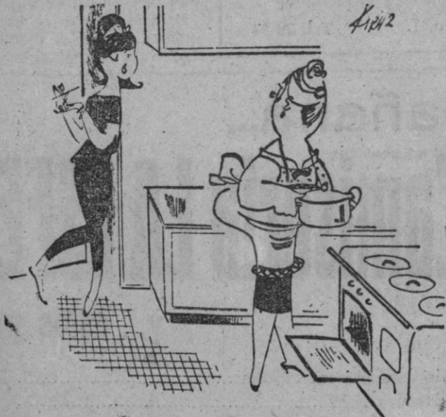
—Me gustaria hacerle creer que fui yo quien preparó el guiso. Deja que se queme un poco.