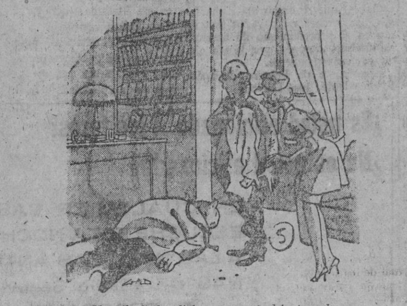
...Yo sólo le he dicho que no podría pagarle.

mejor que la realidad! modelo 1962 de 19" 18.500 ptas. CASA SOLERA