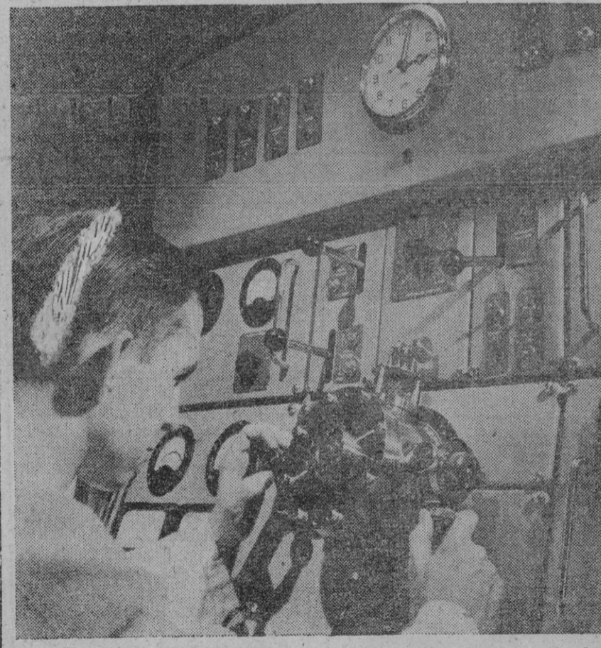
El espectrómetro de masas de la A. E. I., usado en el laboratorio de la Radio Corporation of America, sito en Princeton. Este espectrómetro es un instrumento electrónico para hacer análisis cualitativos y cuantitativos de sólidos. Es tenido por el más avanzado de su índole en el mundo. Como tiene una sensibilidad que le permite detectar una partícula atómica en mil millones, resulta sumamente valioso para los científicos nucleares y los ingenieros electrónicos enfrentados con el problema de detectar impurezas en ciertos materiales que usan

Newkirk, sacando una navaja, prorrumpió en amenazas contra los pasajeros. Los miembros de la tripulación pudieron reducirle después de quince minutos de lucha.