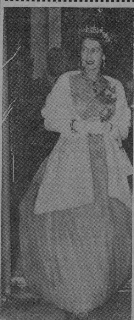
La reina Isabel II de Inglaterra, al salir de la embajada nepalesa en Londres donde le agasajaron con un banquete el rey Mahendra y la reina Ratna de Nepal. Los reyes de Nepal hicieron una visita oficial, de tres días, a Londres