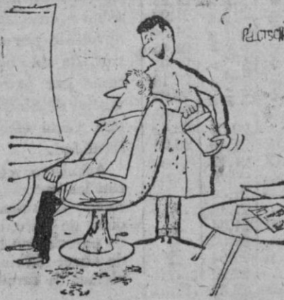
—¿Le mojó un poco los cabellos?

Haga su pedido de BUTANO en San Ildefonso SERVULO MARTINEZ. T.º 37 En Segovia CASA SOLERA Teléfono 14-66