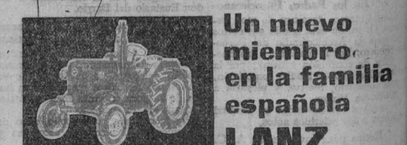
TRACTOR MOD. D. 2.816 MOTOR DIESEL POTENCIA: 28 CV.

Situada en Valseca ALTA SELECCION DE LA RAZA LEGHORN BLANCA Polluelos, pollitas sexadas recién nacidas, pollitas de uno y dos meses. Machitos para carne. HIBRIDOS PARA PUESTA Y CARNE Controlada por CEAS (Criadores Españoles de Aves Selectas). Todos nuestros pollitos proceden de gallinas de alta postura, apareadas con gallos de pedigree importados de la Granja W. A. Derksen de Lob Bij Duiven (Holanda), de fama mundial. Haga sus pedidos con toda anticipación. Pida catálogo gratis. EXCLUSIVA DE VENTA: ALMACENES FERNANDEZ San Facundo, 1. Plaza los Huertos. Frente a Correos.—Teléfono 2697